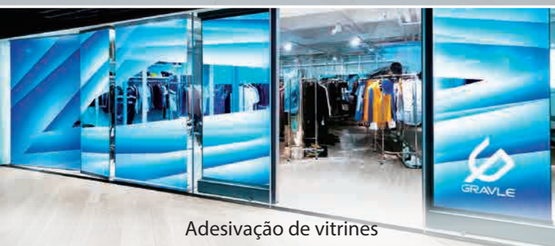
Adesivação de vitrines