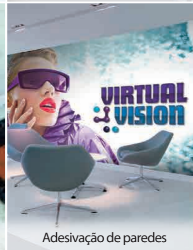
Adesivação de paredes