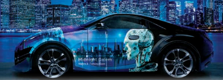
Adesivação de veículos